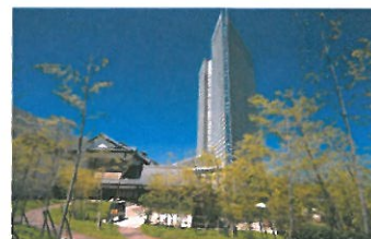
【シェラトン・グランデ・オーシャンリゾート】